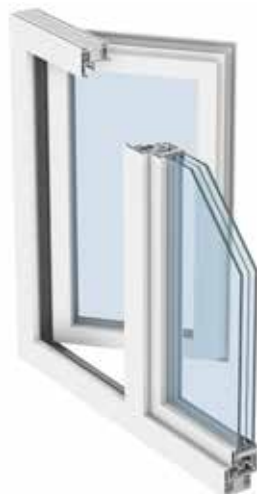
Detalle KÖMMERLING 76 Certificada PassivHaus con relleno de neopor en el marco